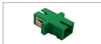
Pasamuros Monomodo SC/SC Simple