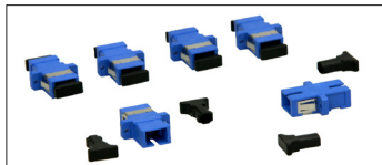
Pasamuros Multimodo SC/SC Simple