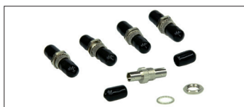
Pasamuros Multimodo ST/ST Simple