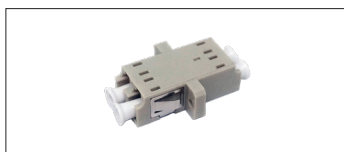
Pasamuros Multimodo LC/LC Doble