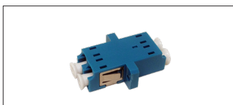
Pasamuros Monomodo LC/LC Doble