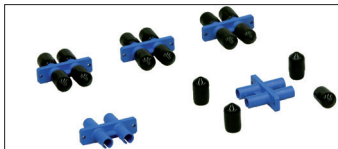
Pasamuros Multimodo ST/ST Doble